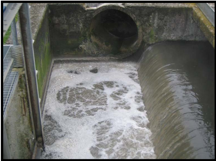
9 Scarico bypass