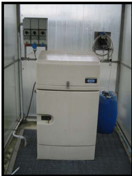
23 Campionatore automatico