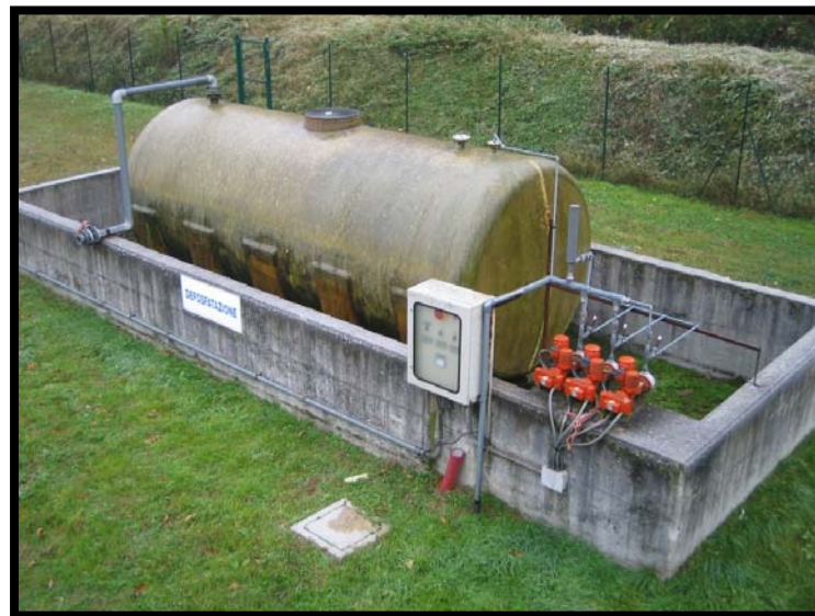
24 Defosfatazione non attiva