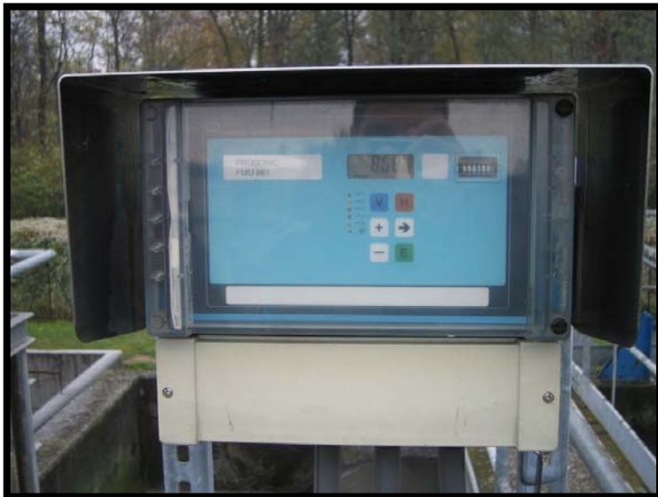
11 Misura portata