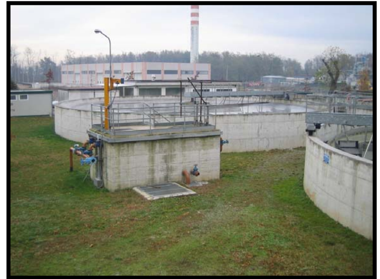
10 Sedimentazione primaria