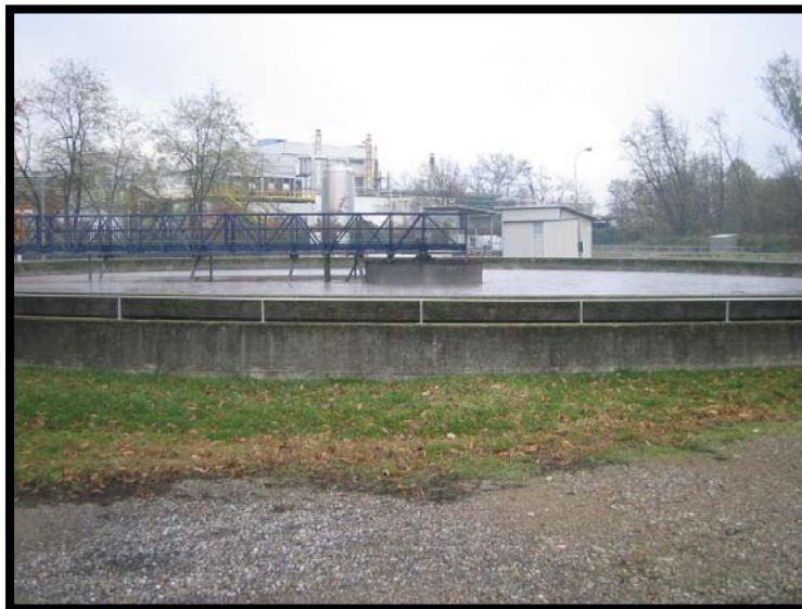
16 Sedimentazione secondaria