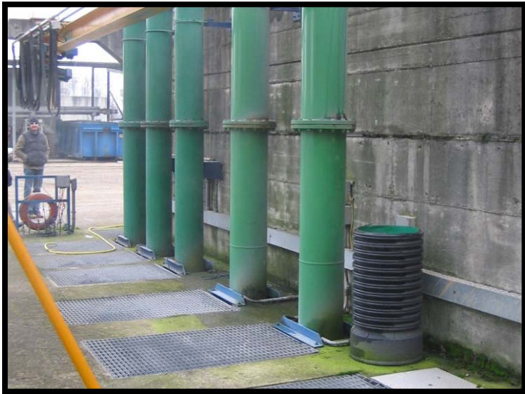
1 Sollevamento reflui