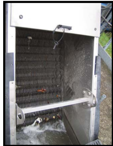
4 Grigliatura a gradini