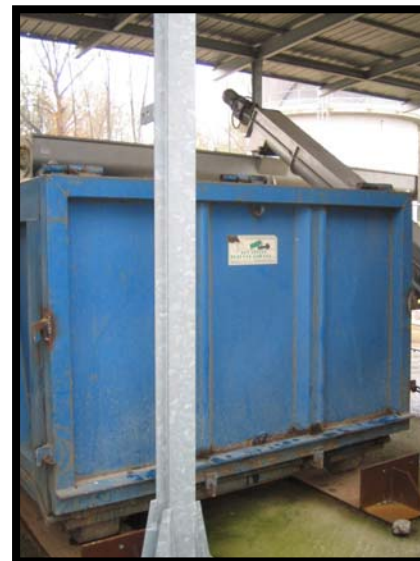
30 Scarico fango disidratato