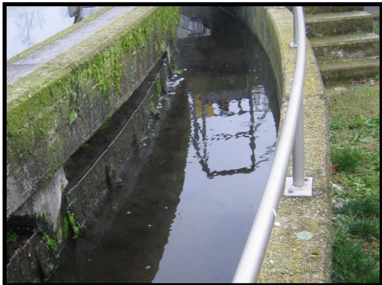
17 Stramazzo sedimentazione secondaria