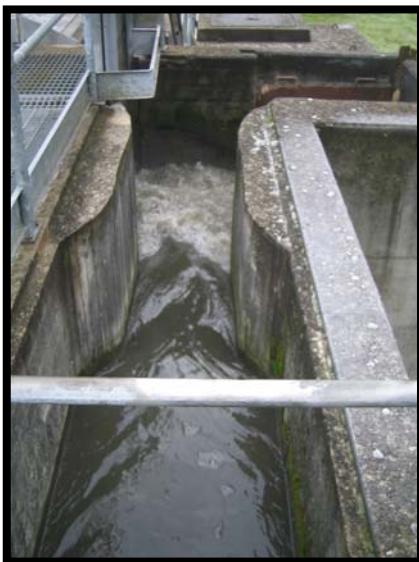
7 Canale venturi