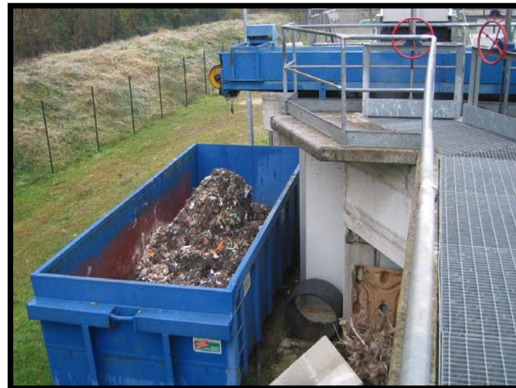
6 Scarico materiale grigliato