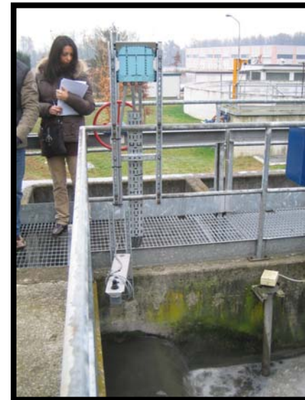
12 Sensore di misura portata