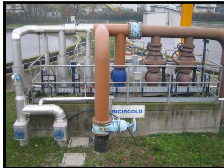
18 Ricircolo fanghi