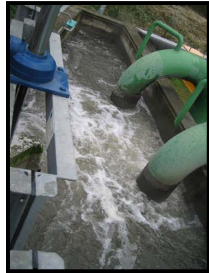
2 Sollevamento reflui