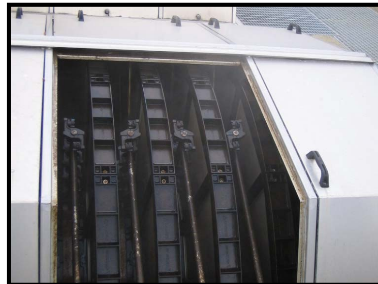
20 Dettaglio filtrazione