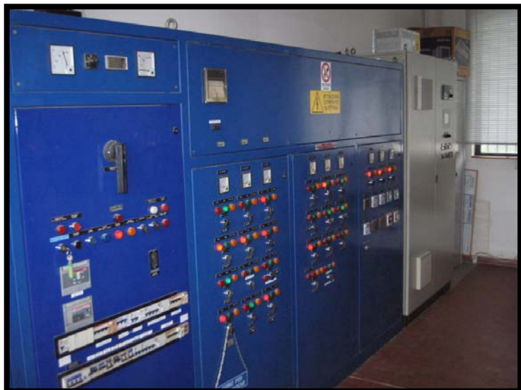
31 Quadro comandi