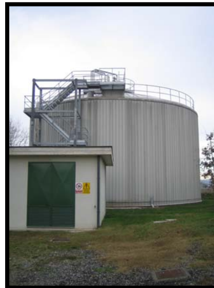
26 Digestore anaerobico