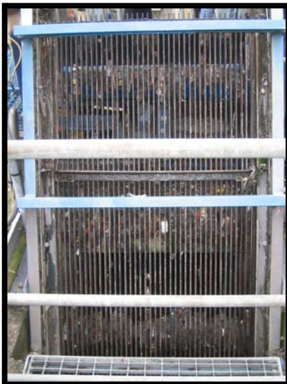
5 Grigliatura a pettine