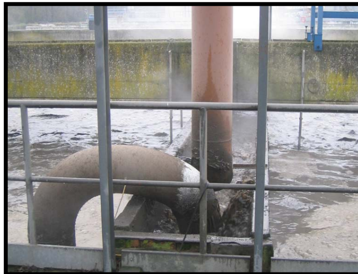
14 Ricircolo fanghi in denitrificazione